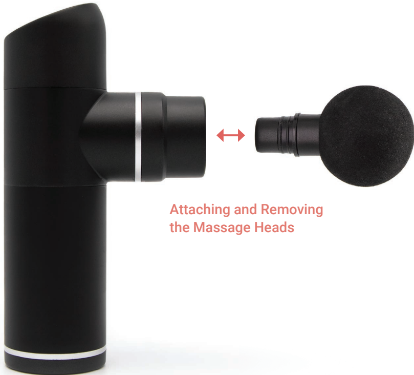
Attaching and Removing the Massage Heads