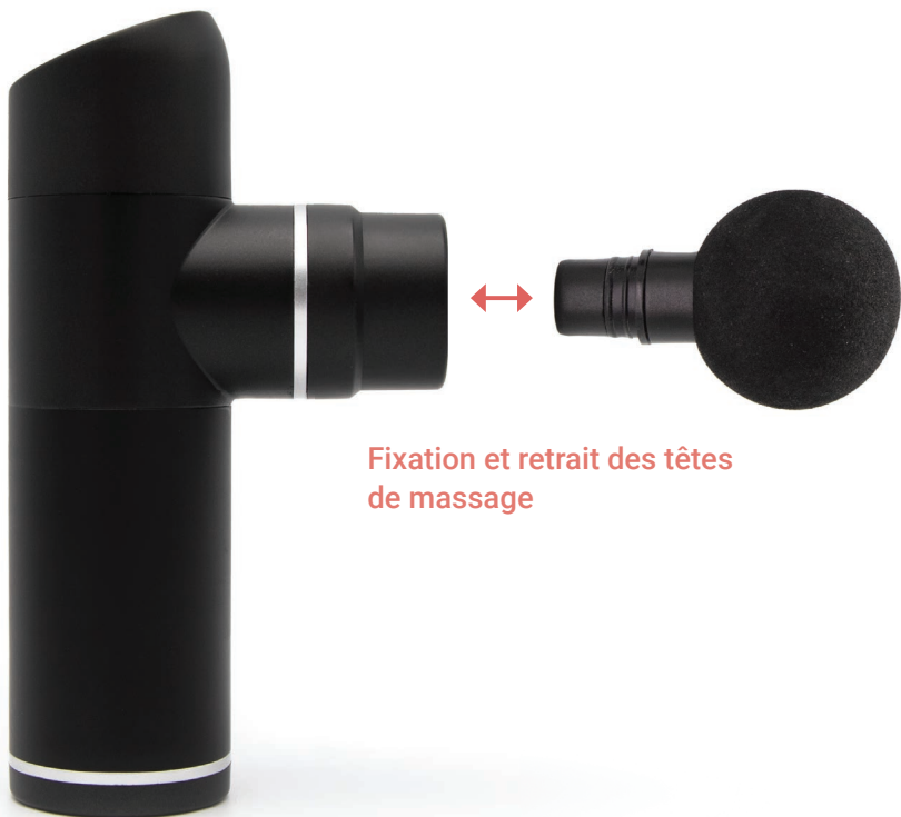
Fixation et retrait des têtes de massage